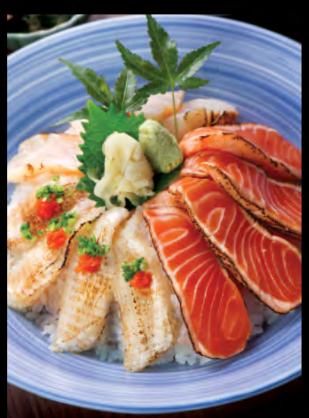
$198 焼霜海鮮丼 霜燒魚生飯 Roasted Sashimi Donburi