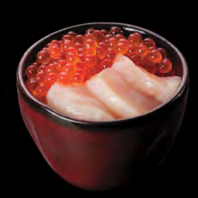
北海道ホタテイクラ丼 北海道帶子日本三文魚籽飯 Scallop & Salmon Roe Donburi