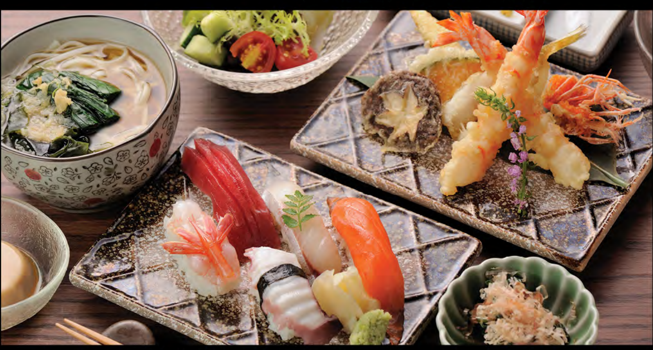
寿司と天ぷら(かけうどん又はそば) 壽司配天扶良麵(烏冬或蕎麥麵) Seasonal Sushi and Tempura Noodles(Udon or Soba)