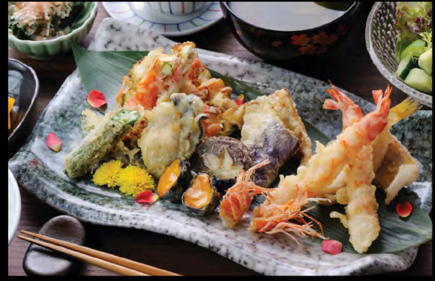
特上天ぷら御膳 特上天扶良御膳 Deluxe Tempura Set