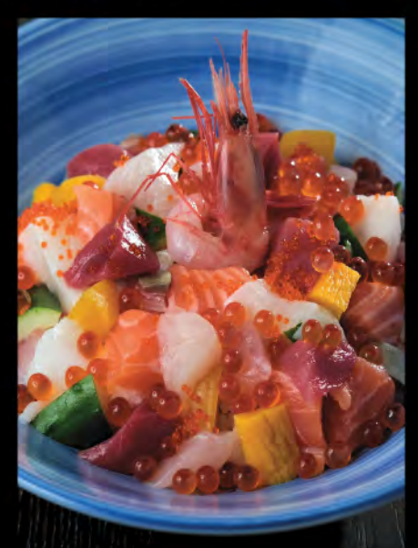
バラちらし丼 角切魚生飯 Cubed Sashimi Donburi