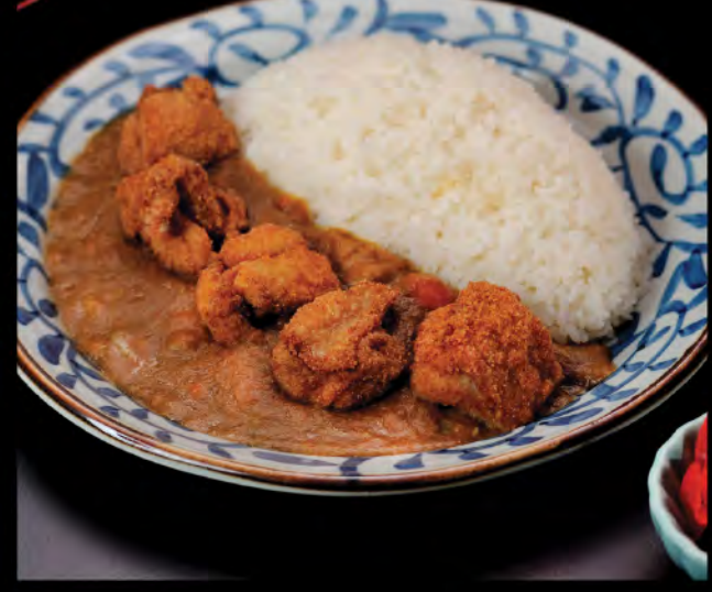
カレーチキン御膳 咖喱日本産炸雞御膳 Japanese Curry (Deep-fried Chicken)