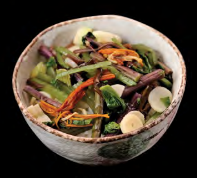
山野菜丼 山野菜飯 Vegetables Donburi