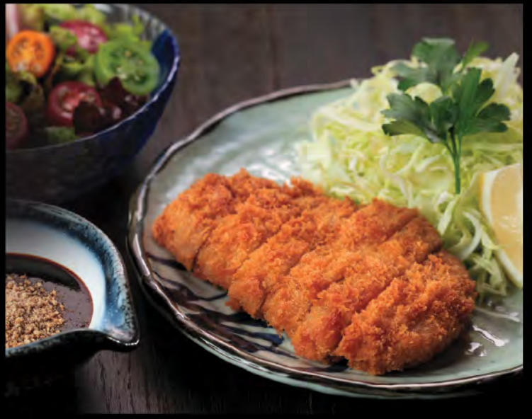
日本産豚カツ御膳 吉列黑豚御膳 Japanese Pork Cutlet Set