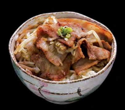
黒豚生姜焼き丼 黑豚肉生薑飯 Japanese Pork with Ginger Sauce Donburi