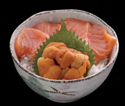
ウニとサーモン丼 海膽三文魚飯 Sea Urchin & Salmon Donburi