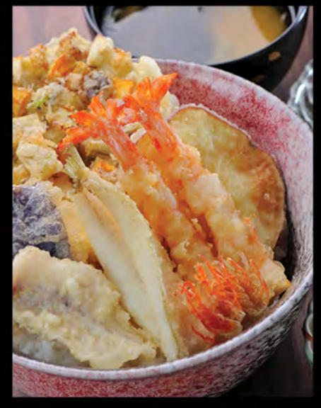
天丼 天扶良飯 Tempura Donburi