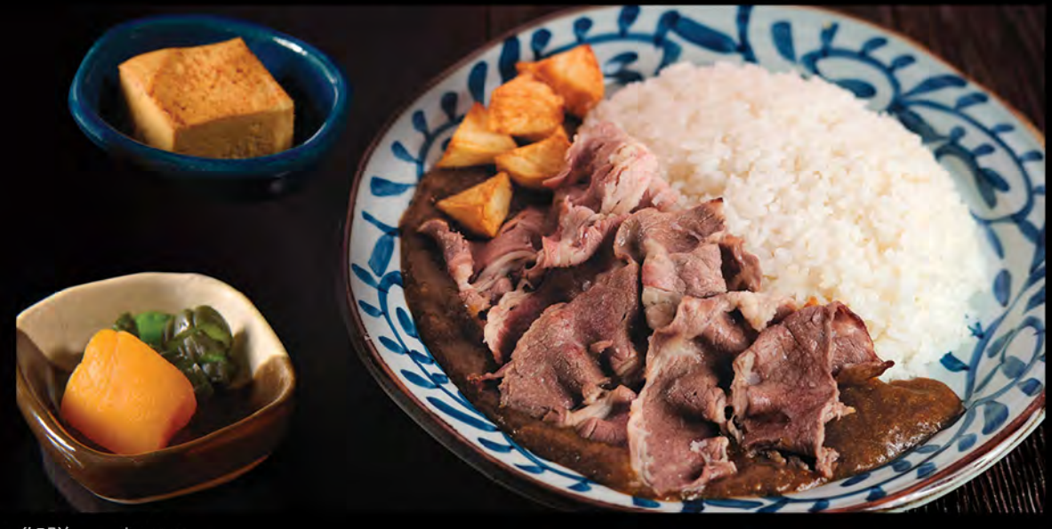
カレービーフ 御膳 咖喱御膳 (美國產牛肉) Japanese Curry (Beef)