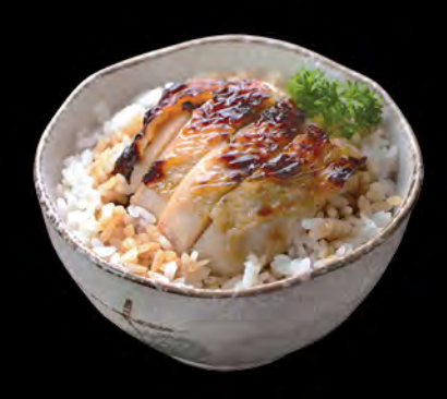
鶏もも照焼き丼 照燒雞飯 Chicken in Teriyaki Sauce Donburi