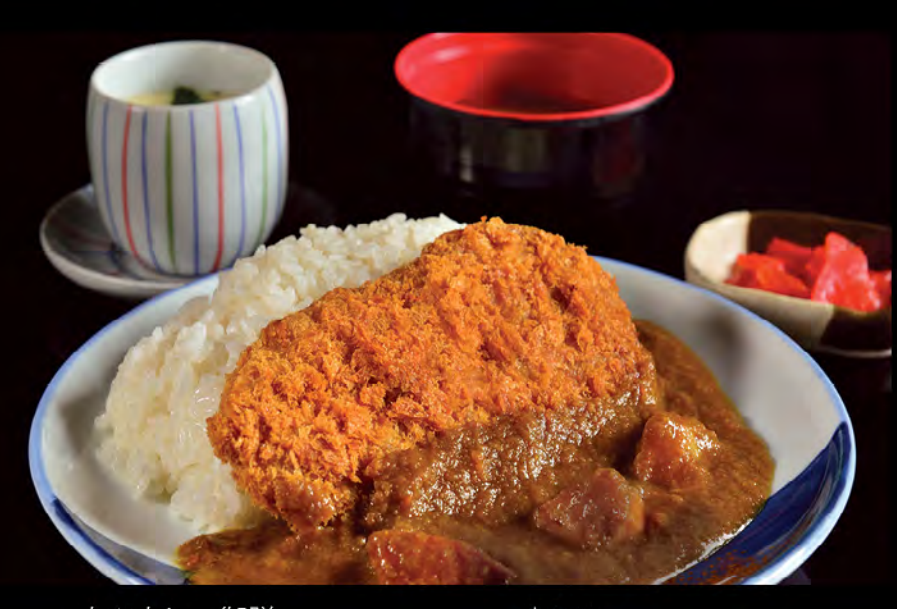
カツカレー御膳 咖喱御膳(日本産吉列黑豚) Japanese Curry (Japanese Pork Cutlet)