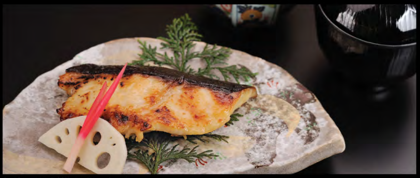
銀だらの西京焼き御膳 燒西京銀雪魚御膳 Grilled Cod Fish Saikyo Style Set

美國產和牛照焼き御膳 美國產照燒牛扒御膳 $218 Grilled US Beef Set