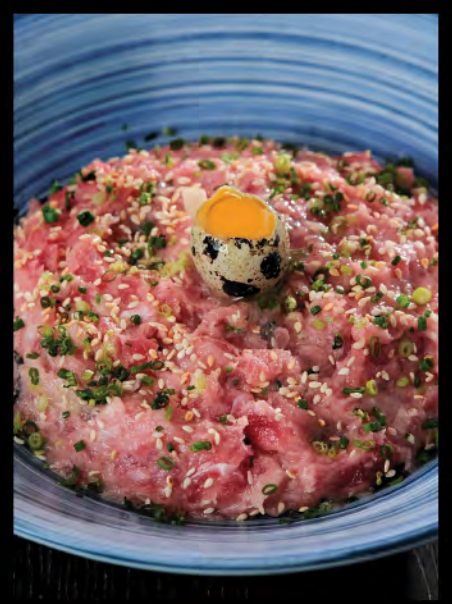
$198 ねぎトロ丼 葱吞拿魚腩飯 Minced Tuna & Spring Onion Donburi