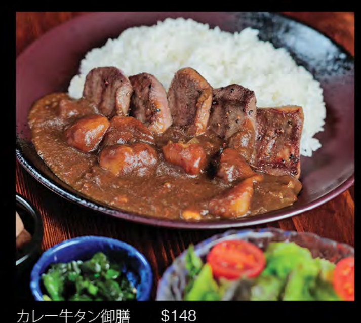
カレー牛タン御膳 咖喱牛脷御膳 Curry Ox Tongue Set