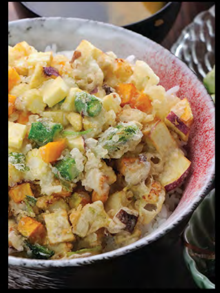
野菜天丼 $158 天扶良野菜餅飯 Mixed Vegetable Cake Tempura Donburi