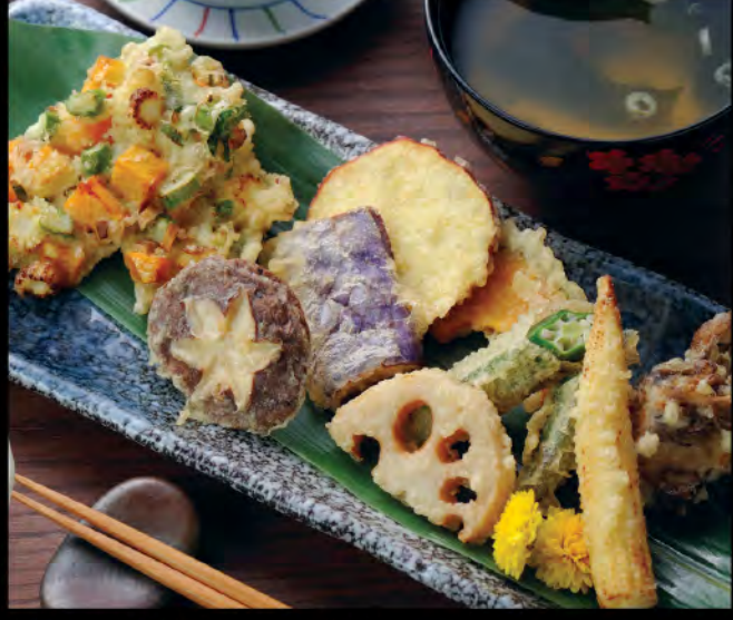
野菜天ぷら御膳 野菜天扶良御膳 Vegetable Tempura Set