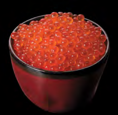
日本産イクラ丼 日本三文魚籽飯 Japanese Salmon Roe Donburi