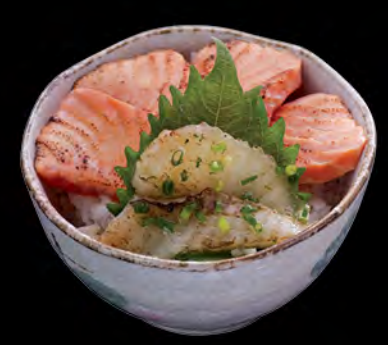
焼霜海鮮丼 霜燒魚生飯 Roasted Sashimi Donburi