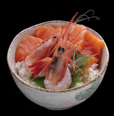
サーモン甘えび丼 三文魚甜蝦飯 Salmon & Sweet Shrimp Donburi