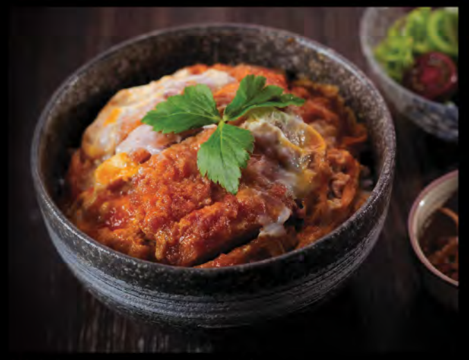
カツ丼 日本産吉列黑豚滑蛋飯 $158 Japanese Pork Chop Cutlet with Egg and Rice