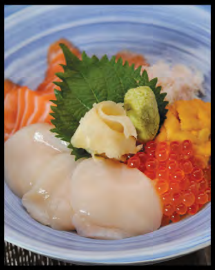
$218 北海丼 (ウニ/サーモンハベら/ホタテ/かに) $218 親子丼 (雌/いべら) 北海道刺身飯 魚生親子飯 (三文魚/三文魚籽) Salmon with Salmon Roe Sashimi Donburi