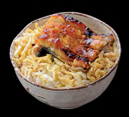
うな丼 浦焼鰻魚飯 Grilled Eel Donburi