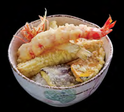
天井 天扶良飯 Tempura Donburi