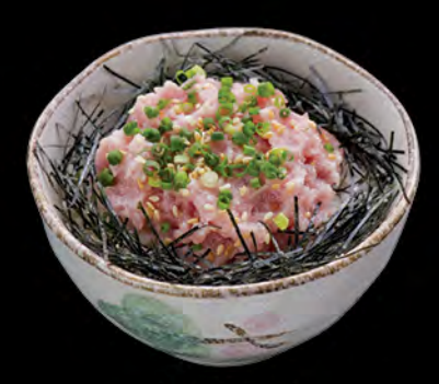
ねぎトロ丼 葱吞拿魚生飯 Minced Tuna & Spring Onion Donburi