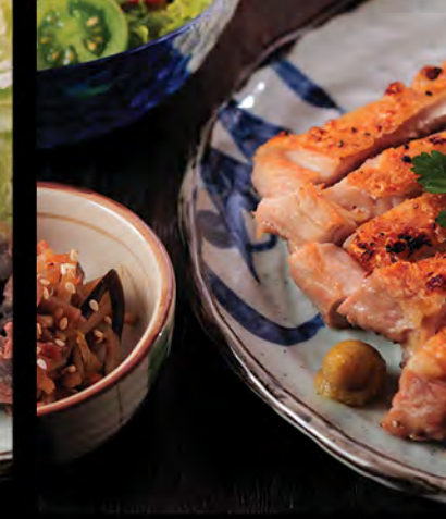
日本産鳥もも照焼き御膳 $148 照燒日本地雞扒御膳 Grilled Japanese Chicken Set

サラダ・小鉢・香の物・海鮮の茶碗むし・ご飯・みそ汁・デザート 沙律、前菜、漬物、海鮮蒸蛋、白飯、味噌汁、甜品 Salad, Appetizer, Pickles, Steamed Egg with Seafood , Rice, Miso Soup, Dessert