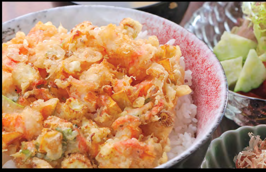
かき揚げ丼 $168 天扶良蝦餅飯 Mixed Vegetable and Shrimp Tempura Cake Donburi