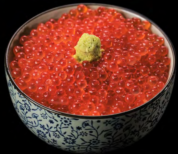
イクラ丼 (日本産) 日本三文魚籽飯 Japanese Salmon Roe Donburi $398

北海道ホタテイクラ丼(日本産) 帶子三文魚籽飯(北海道帶子2隻·日本三文魚籽) Scallop & Salmon Roe Donburi (Hokkaido Scallop 2pcs & Japanese Salmon Roe) $398