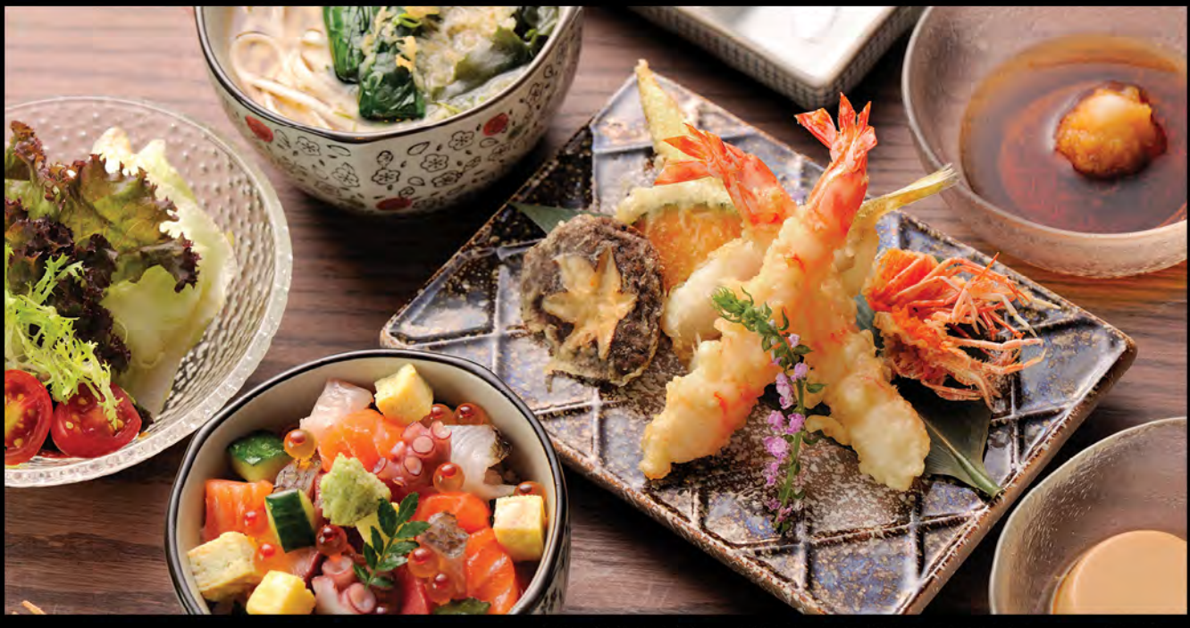
ばらちらし丼と天ぷら(かけうどん又はそば) 魚生飯配天扶良麵(烏冬或蕎麥麵) Special Sashimi Donburi and Tempura Noodles (Udon or Soba)