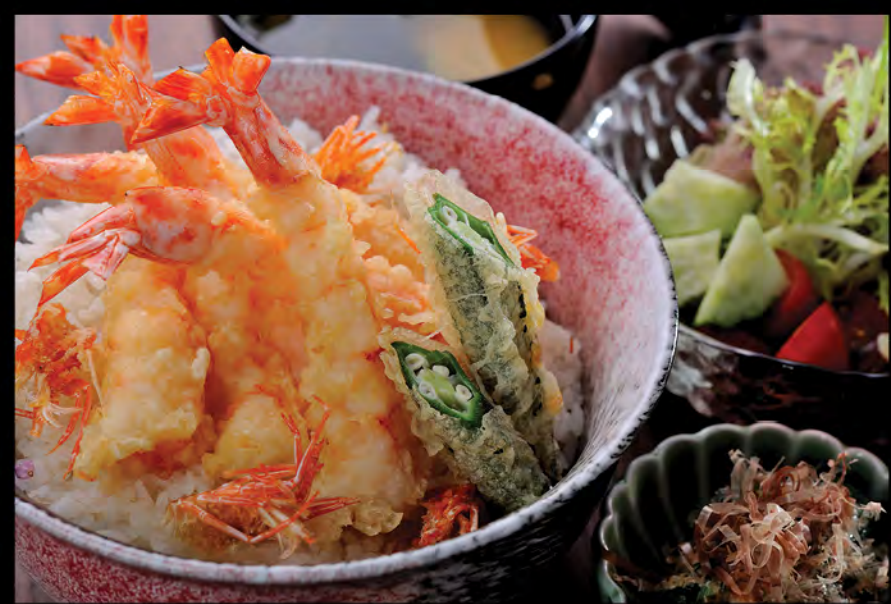
海老天丼 (5本) $188 蝦天扶良飯 (5件) Live Prawn Tempura Donburi (5 Pcs)