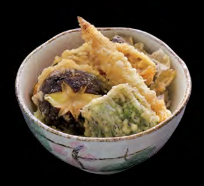
野菜天丼 野菜天扶良飯 Tempura Vegetable Donburi