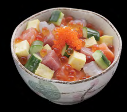
ばらちらし丼 雑錦魚生飯 Special Sashimi Donburi