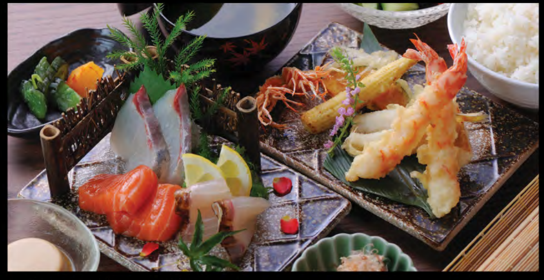
天ぷらと刺身御膳 天扶良刺身御膳 Tempura and Sashimi Set