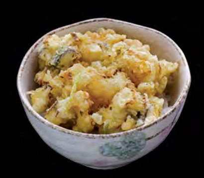
かき揚げ丼 天扶良蝦餅飯 Tempura Shrimp Cake Donburi