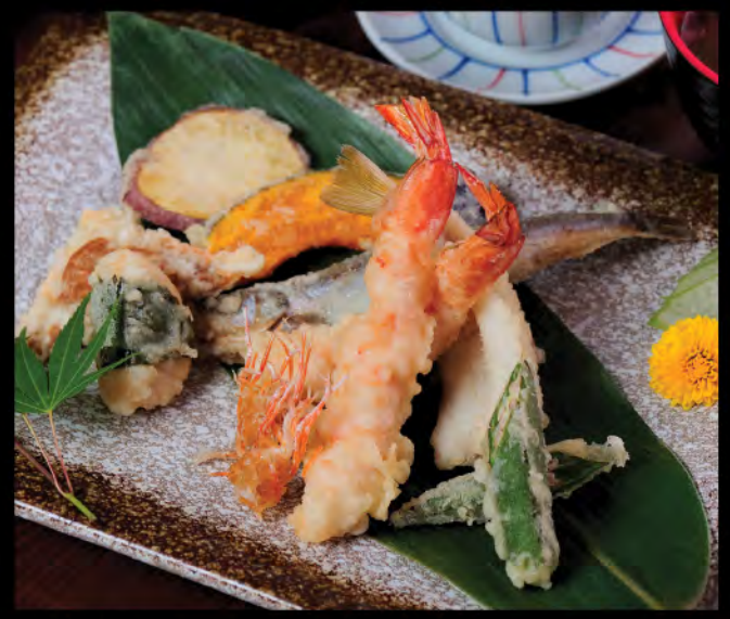
天ぷら御膳 天扶良御膳 Tempura Set