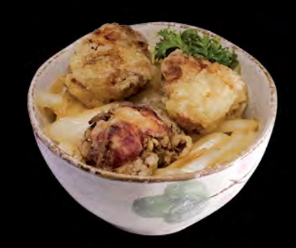
若鶏唐揚げ丼 日式炸雞飯 Deep-fried Chicken Donburi