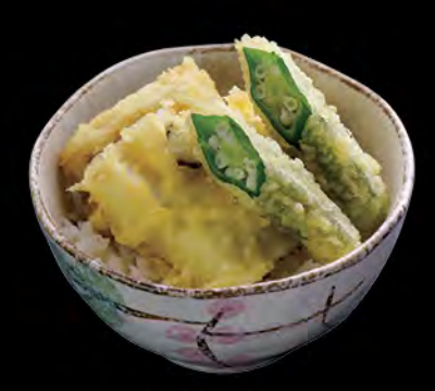
穴子天丼 穴子天扶良飯 Tempura Sea Eel Donburi