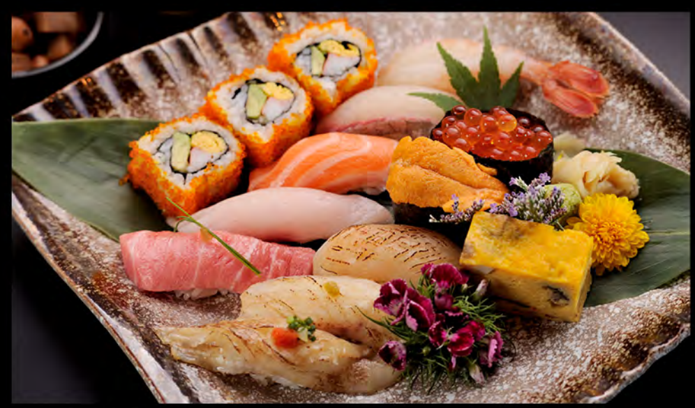
特上寿司御膳 特上壽司御膳 Deluxe Sushi Set