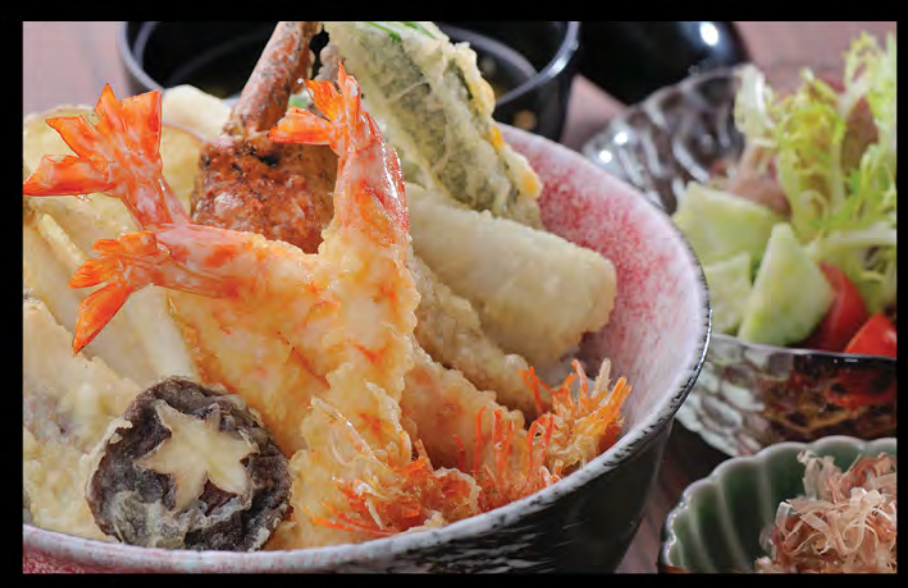
特上天丼 特上天扶良飯 Deluxe Tempura Donburi