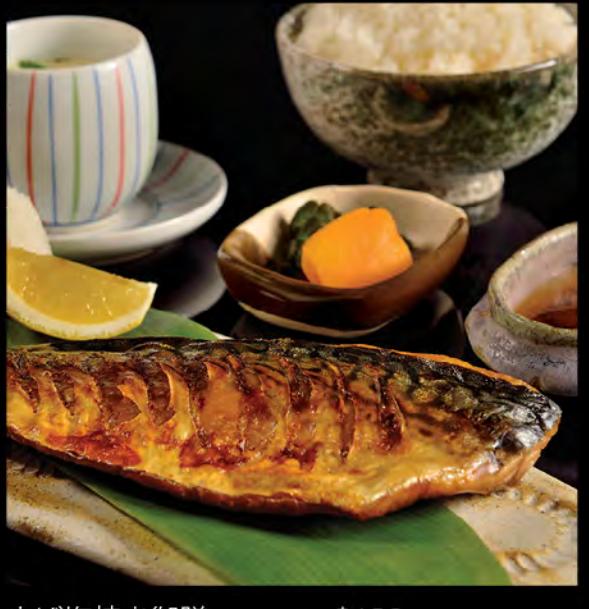
さば塩焼き御膳 燒鯖魚御膳 Grilled Mackerel Set