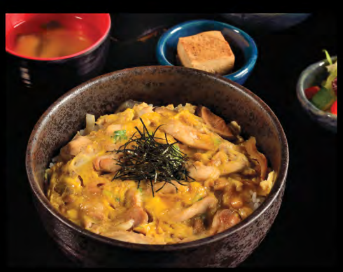
親子丼 $13 日本產地雞親子飯 Japanese Chicken with Egg and Rice $138