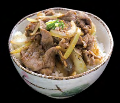
牛丼 汁燒牛肉飯 Grilled Slice of Beef Donburi