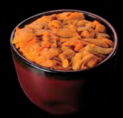
うに丼 海膽飯 Sea Urchin Donburi