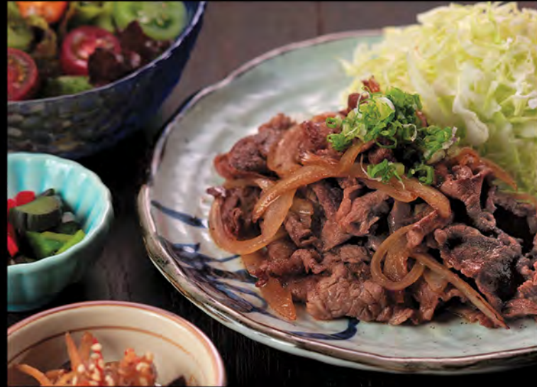
豚焼き生薑御膳/牛焼き生薑御膳 黑豚肉生薑燒御膳/牛肉生薑燒御膳 Japanese Pork with Ginger Sauce Set / Beef with Ginger Set