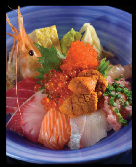
ちらし丼 雜錦魚生飯 Sliced Sashimi Donburi

Minced Tuna & Spring Onion, Salmon Roe and Sea Urchin Donburi