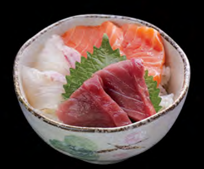
三色丼 三色飯 Salmon, Red Tuna & Snapper Donburi