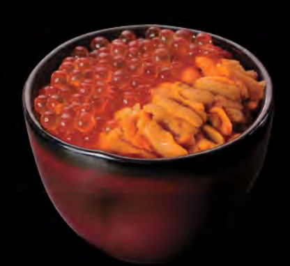
うにイクラ丼 海膽日本三文魚籽飯 Sea Urchin & Salmon Roe Donburi